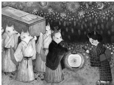
▲昔話「意地悪な姑」の挿絵