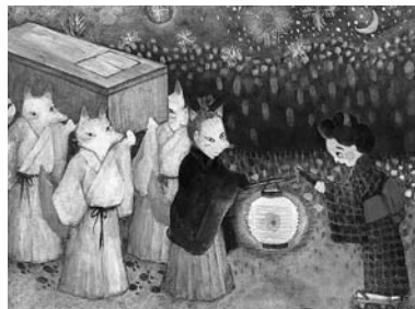
▲昔話「意地悪な姑」の挿絵