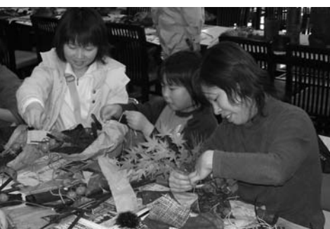
オリジナル作品が完成した木炭アートづくり

光が地面まで届かないため、木の育ちが悪くなり、下草も生えなくなりまます。それらの成長を助けるためにも、間伐は大変重要な作業。皆さんで実際に切ってもらい、何年後に成長した木を見にきてほしい」と話しました。