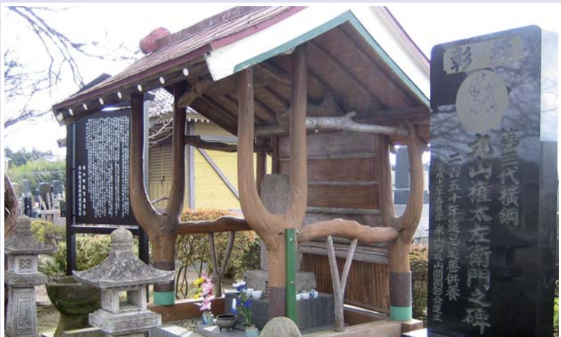
「第三代横綱丸山権太左衛門の銅像と丸山堂」

問い合わせ：【銅像】道の駅米山 ☎ 0220 (55) 2747 【丸山堂】松寿院 ☎ 0220 (55) 1141