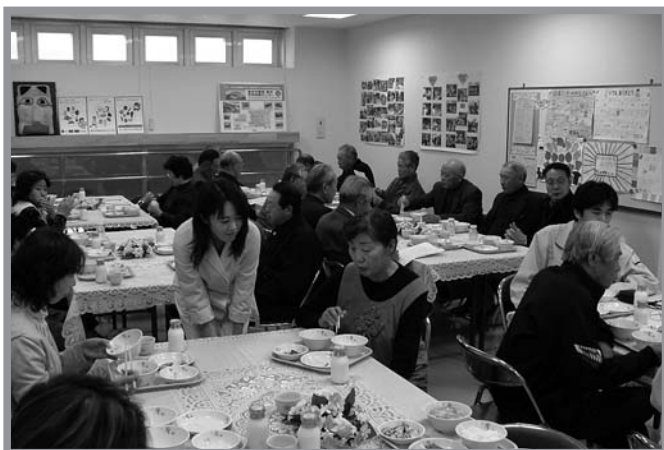
▲孫や子どもたちが普段食べている給食を試食する参加者

つやま幼稚園の生活発表会が12月2日、同園で開催され、園児や保護者ら約200人が参加しました。園児たちは、メロディーベルでの演奏や手話で「すうじの歌」を披露。遊戯では8つのグループに分かれて元気いっぱいに踊りました。また、年少と年長に分かれての劇では、はっきりとした口調でせりふをしゃべり、笑いあり涙ありの演技に会場から大きな声援が送られました。最後はクリスマスにちなんでサンタクロースが登場し、園児たちは大喜び。頑張った練習したご褒美となりました。