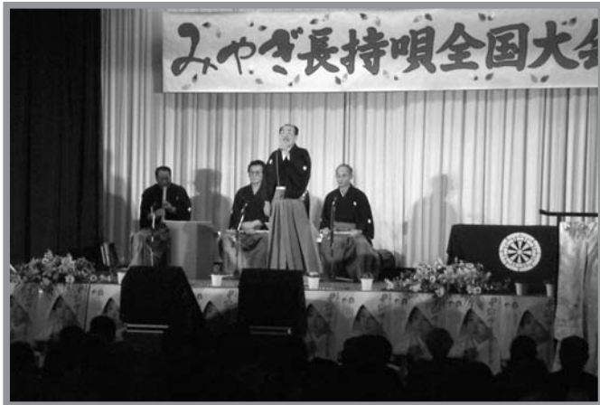
▲婚礼の席には欠かせない「長持唄」を熱唱する参加者