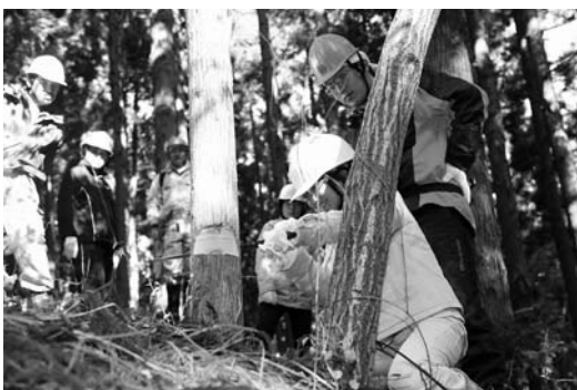
のこぎりを使って伐採する参加者

光が地面まで届かないため、木の育ちが悪くなり、下草も生えなくなりまます。それらの成長を助けるためにも、間伐は大変重要な作業。皆さんで実際に切ってもらい、何年後に成長した木を見にきてほしい」と話しました。