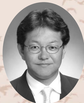
登米市長 布施 孝 尚