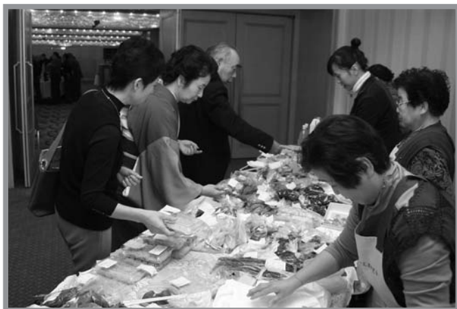
▲懐かしむかのように石越産の農産物や加工品を買い求める在京者

第13回東京いしこし会総会・交流会が12月2日、東京の東天紅上野店 とうてんこう で開催され、石越出身の在京者ら約110人が参加しました。総会后に開催された交流会では、赤谷神楽会と石越民謡同好会の会員が郷土芸能や民謡を披露。参加者は昔を思い出しながら、懐かしそうに見入っていました。会場には地元農産物や加工品の販売コーナーが設けられ、ふるさとの味を買い求める人でにぎわいました。また、用意された石越の地酒「澤乃泉」を酌み交わしながら、昔の話や近況などを話す姿も随所で見られました。