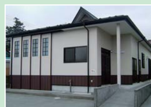
登米町後小路町内会で整備した 集会施設