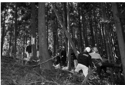
参加者の伐採作業によって木が倒れる様子

使って伐採作業に挑戦。なかなか進まない作業に苦労しながらも、一本一本慎重に伐採しました。