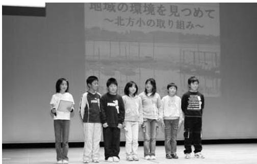
授業で取り組んだ環境保全活動を発表する北方小児童

生活排水対策重点地域水洗化促進宮城大会（登米・栗原市共催）が12月5日、登米祝祭劇場で開催され、両市の公衆衛生組合連合会員、保健活動推進員、食生活改善推進員ら約600人が参加しました。