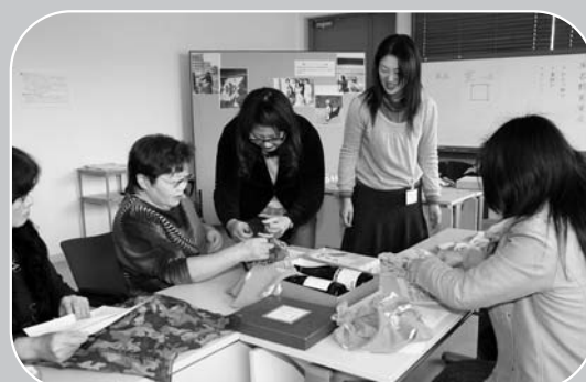
▲風呂敷を使ってティッシュボックスカバーに挑戦

昔からある風呂敷の良さを見直そうと、「昭和の布・ふろしき実演会」が12月3日、歴史博物館で開催されました。「ふろしき研究会」会員でもある同館職員が講師。参加した風呂敷愛好者15人は、歴史や語源の学習後、真結び、平包みなどの伝統的な結び方や、ウエストポーチ、巾着袋などにも挑戦し、風呂敷の多様な用途に感心していました。