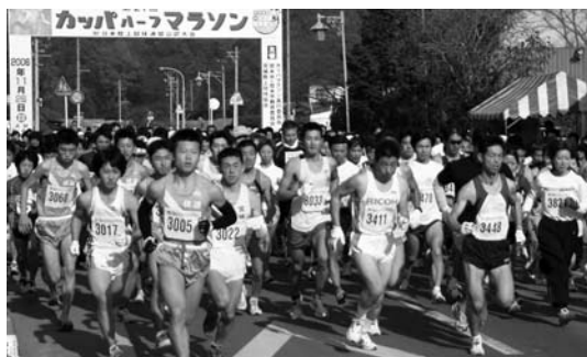
出場者1,733人が白熱したレースを展開

主会場では「とよま産業まつり」も同時に開催。とよま産の牛肉と豚肉の試食や地場産品などの販売コーナーも設けられ、大勢の人でにぎわった一日となりました。