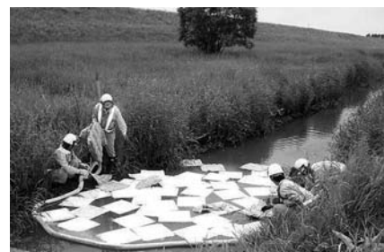
▲川に流出した油の吸着マットによる回収作業