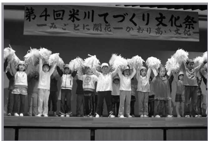
▲会場がひとときわ沸いた米川聖マリア保育園の園児による遊戯

“みごとに開花・かおり高い文化”をテーマに、「米川てづくり文化祭」が12月2、3日の両日、米川公民館で開催されました。写真や絵画の展示、舞踊、カラオケなどの発表を通して、地域住民の交流を深めることが目的で4回目の開催。ステージでは、米川聖マリア保育園の園児が遊戯を披露し、小さい体で元気いっぱい踊り、会場から盛んな拍手が送られました。また、屋外では旬の野菜や果物を販売する地場産品コーナーなども設けられ、大勢の来場者でにぎわいました。