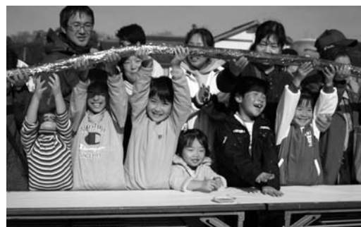
これまでで最長となる121mのカップ巻が見事完成

第21回カップハーフマラソン（同実行委員会主催）が11月26日、登米総合体育館前を主会場に開催されました。