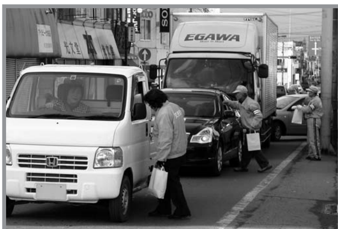
▲ドライバーにゆでタマゴとチラシを配り交通事故ゼロを願いました

「飲酒運転・高齢者の交通事故0（ゼロ）作戦」が12月18日、佐沼の錦橋近くで行われました。この活動は佐沼警察署の協力で、冬の交通安全活動の一環として実施。佐沼地区交通安全協会佐沼支部、佐沼交通安全母の会、佐沼婦人会、市迫地区交通安全推進協議会などの団体から15人が参加しました。参加者は、冬道の安全運転や飲酒運転の根絶、高齢者の事故防止などを通るかかったドライバーに呼び掛けながら、数字の0（ゼロ）に見立てた「ゆでタマゴ」とPR用のチラシを配りました。