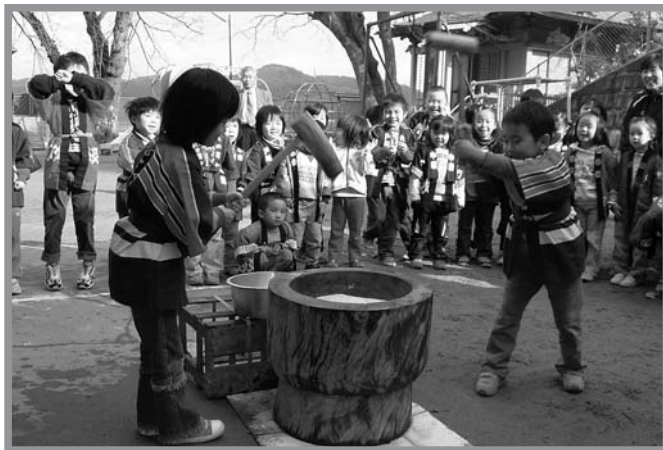
▲きねと臼を使った昔ながらのもちつきに挑戦する園児たち

防火講習会ともちつきが12月6日、北上保育園で催され、園児や保護者ら約120人が参加しました。幼いころから防火の大切さを学んでもらおうと、同園が毎年実施している行事で、市消防署津山出張所の協力で開催。園児たちは、そろいの法被 はっぴ を着て消防署員の話の聞いたり、幼児向けの防火ビデオを見たりして、防火の大切さを学びました。また、講習会終了後には署員や保護者らと一緒に、きねと臼を使った昔ながらのもちつきに挑戦。大きな声で「火あそびしません」と誓いながら、元気につきました。