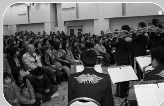
▲音楽隊の迫力ある演奏を間近で鑑賞できました

陸上自衛隊東北方面音楽隊の演奏会が12月3日、ホテルニューグランヴィアで開催され、親子連れら約600人が集まりました。音楽隊は54人編成で、年間100回におよぶコンサートや演奏会を東北6県で実施しています。この日はアニメメドレーなど8曲を演奏。トロンボーンなどのソロ演奏もあり、会場から盛んに拍手が送られました。