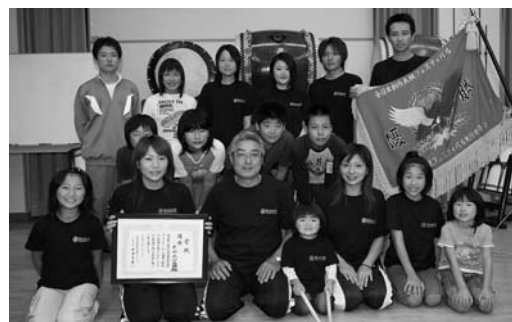
米山丸山太鼓は家族のようなチームワークが自慢

第6回全日本創作太鼓フェ スティバル（同実行委員会主 催）が9月3日、北上市で開 かれ、米山町の「米山丸山太 鼓」が優勝しました。 フェスティバルには、演奏 のビデオや活動内容などで、