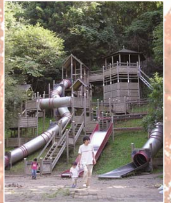
週末は子どもたちでにぎわうわんぱく砦

公園内には、ピクニックなどに利用できる芝生の広場と、山の斜面を利用したフィールドアスレチック（わんぱく砦）もあり、子どもたちに大人気です。特に夏から秋にかけては、子ども会行事などで数多く利用されており、県内各地から親子連れが集います。 また、併設されている「ふくろうの森キャンプ場」は、テントサイト（6区画）のほか、炊事棟、あずまや、温水シャワー、トイレなどを完備。川の流れを眺めながらアウトドアレジャーを楽しむこともでき、リピーターが多い公園となっています。