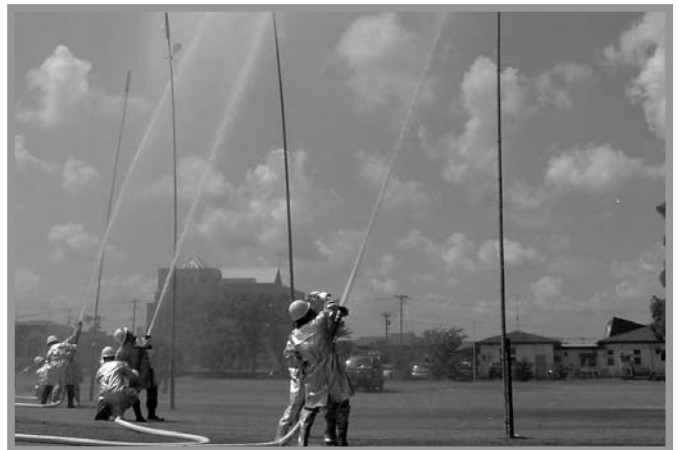
▲いざというときに備え本番さながらに訓練をする団員

【総合】第1位＝4分団、第2位＝2分団、第3位＝自動車分団 【小隊訓練】第1位＝4分団