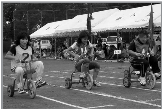
▲バラエティーに富んだ競技を楽しみながらも真剣に競技する参加者