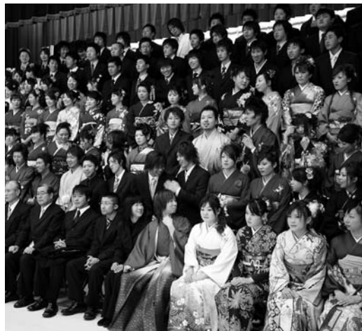
昨年の成人式の模様(南方会場)