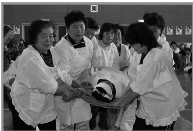
▲真剣な表情で応急処置訓練をする参加者