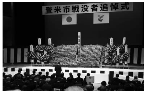
永遠の平和を誓った戦没者追悼式