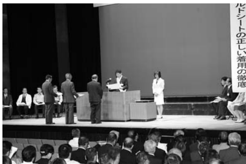
交通安全に功勞した団体、個人を表彰する布施市長

参加者全員には、夜間に使用する反射材や「交通ルール守るあなたが守られる」とプリントされたチューインガムが配布されるなど、交通安全の意識を高める工夫がなされた大会でした。