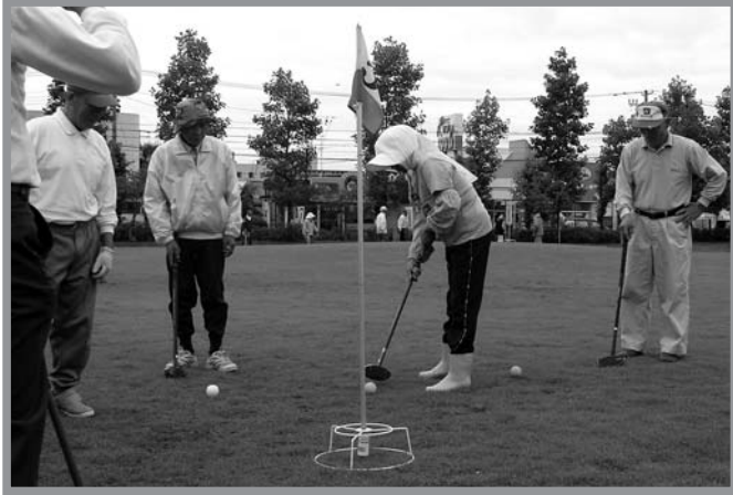
▲地区の代表16チームが競った迫老連シニアスポーツ大会