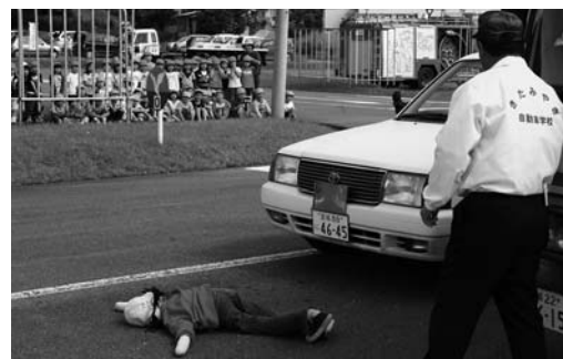
人形を使った横断中の接触事故を見学

職員、自動車学校職員らの指導のもと、正しい横断歩道の渡り方を体験。園児たちは、左右を見て車が来ないことを確認し、手を高く上げて渡りました。