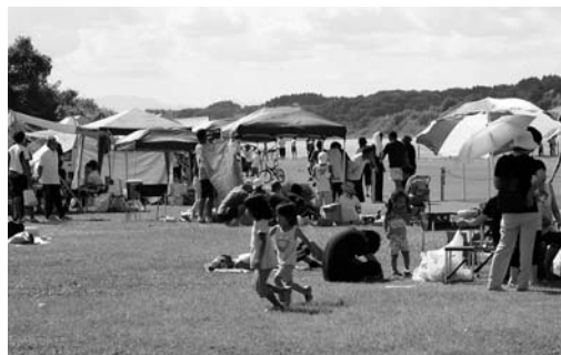
昼食時には各クルーの参加者たちが親睦を深めました

第17回長沼レガッタ・登米市民ポート大会（市教育委員会、迫漕艇協会主催）が9月3日、長沼ポート場で開催されました。