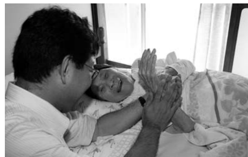
▲市長の訪問を喜び手を握るさかよさん

そんなさかよさんは「早く足を治して、もう一度自分の足で歩きたい。茶の間で家族全員でご飯を食べたり、掃除