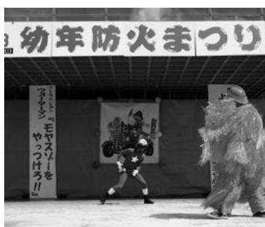
アトラクシヨ ンで正義の味 方を応援する 園児たち（上） 教諭、消防署 員らによるア トラクション （中）華麗なよ さこい踊りを 披露した豊里 幼稚園児（下）

元気いっぱいでの踊りに 参加者から盛んな拍手 が送られました。 また、アトラクシヨ