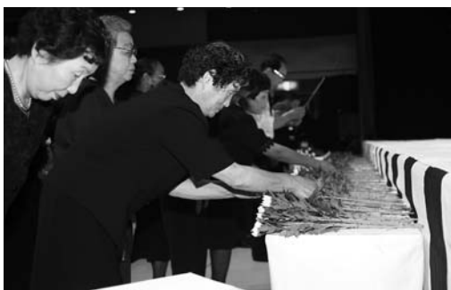
献花して戦没者の冥福を祈る参列者

市戦没者追悼式が9月1日、登米祝祭劇場で行われ、各町の遺族や関係者ら約600人が参列しました。初めに、太平洋戦争などで亡くなった戦没者の冥福を祈り、参列者全員で黙とうをさ