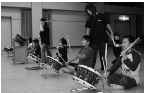
週2回の夜間練習に励む会員

第6回全日本創作太鼓フェ スティバル（同実行委員会主 催）が9月3日、北上市で開 かれ、米山町の「米山丸山太 鼓」が優勝しました。 フェスティバルには、演奏 のビデオや活動内容などで、