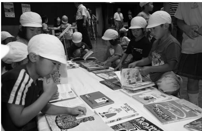
展示されたたくさんの絵本や原画で楽しむ園児たち

助役は「絵本は子どもたちの健やかな成長に大変役立つもの。市としてもサポートを続けていきたい」と祝辞を述べました。