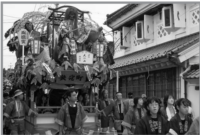
▲山車12台とみこし4台の行列に沿道がにぎわった「とよま秋まつり」