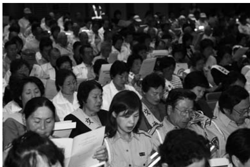
参加者全員による交通安全宣言