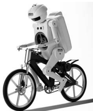
当日は最新技術を取り入れて製作された、「自転車に乗るロボット」の実演があります