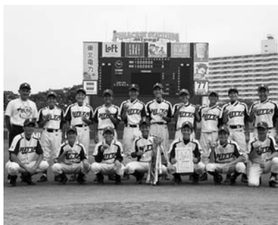
優勝した新田中野球部員