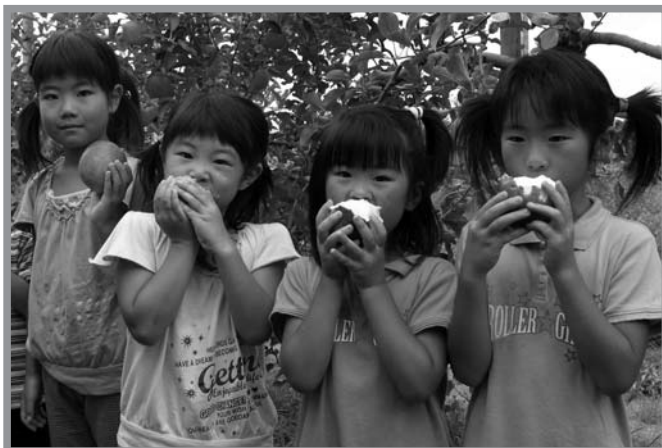
▲もぎたての真っ赤なリンゴをおいしそうに食べる子どもたち

秋の体験イベント「リンゴ狩り」が9月9日、東和町嵯峨立地区のリンゴ団地で行われ、市内外から約40人が参加しました。東和道の駅農林産物出荷組合の主催で、生産者と消費者との交流が目的。キノコのホダ木作り、シイタケ収穫体験などが行われた「春を食べよう市」に続く体験交流事業の第2弾。今年のリンゴは残暑の影響を受け、例年より多少色付きが遅かったものの当日には真っ赤に色付き、参加者はおいしそうなリンゴを収穫しました。また、収穫後には豚汁も振る舞われ、秋の味覚を満喫しました。