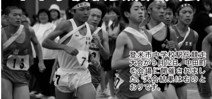
登米市中学校駅伝競走大会が9月12日、中田町を会場に開催されました。大会結果は右のとおりです。