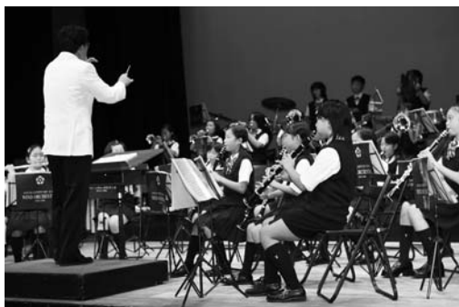
華麗な演奏を披露した佐沼小吹奏楽部の児童たち