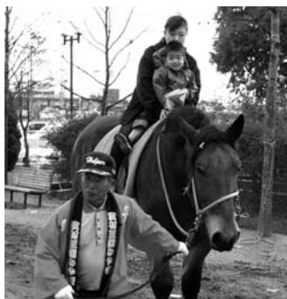
昨年の「動物ふれあいコーナー」の乗馬体験