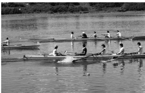
地元クルーにより熱戦が繰り上げられた長沼レガッタ