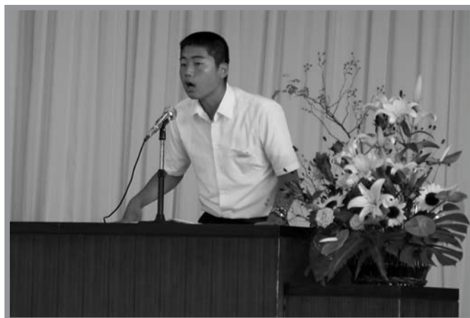
▲自分の夢や経験で感じたことなどを力強く発表する生徒たち