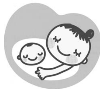
マタニティマーク

そこで、妊産婦さんへの思いやりをマークにしたのが「マタニティマーク」です。もしも、街や職場などで、このマークを付けている妊産婦さんや子育て中のお母さんを見かけたら、皆さんからの思いやりある気遣いをお願いします。