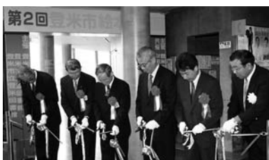
関係者らによるテープカットが行われた開場式