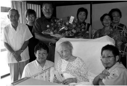
▶みさをさんの家族みんなで長寿のお祝いをしました

市長は「何でもおいしいと思つて食べることが健康でいられる条件。これからもたくさんおいしいものを食べて、長生きしてください」と声を掛けました。