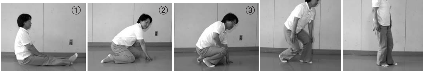
↑計測開始 長座位立ち上がり動作の方法 ↑計測終了