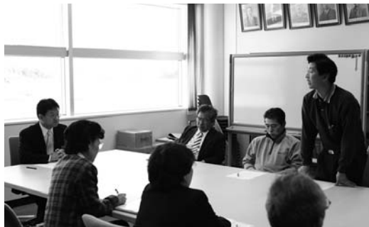
南方で行われたところでも市長室

〒987-10511 登米市迫町佐沼字中江二丁目6番地1 総務部総務課 ☎ 0220(22)2090 FAX 0220(22)9164 ✉ koho@city.tome.miyagi.jp