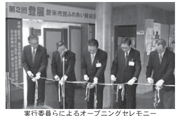
実行委員らによるオープニングセレモニー