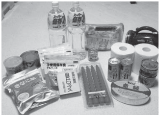
いざというときのために備えておきましょう。