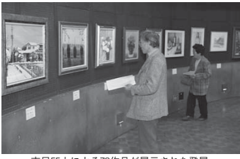
市民55人による78作品が展示された登展

第2回登米市民ふれあい美術展「登展」（登展実行委員会、助登米文化振興財団主催）が5月2日から7日までの6日間、登米祝祭劇場小ホールで開催されました。美術展は、登米市誕生を記