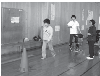
高齢者健診でのUPアンドGO (石越会場)