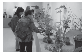
1200人が訪れた春の創作山野草展（津山町）