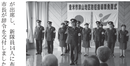
規律正しい動作で隊員紹介が行われました