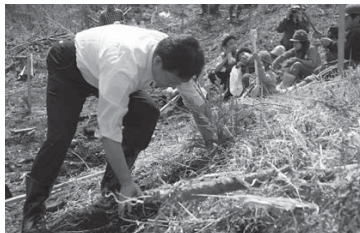
布施市長も自ら植樹に挑戦