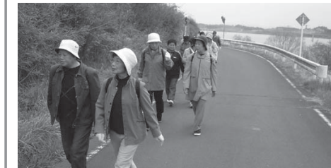
長沼周辺の春の景色を眺めながらウオーキングを楽しむ参加者

ゴール地点の長沼フットピア公園に到着しました。到着後、多くの参加者から「まだ歩き足りない」「まだまだ元気」「など声が上がり、急ぎよコースを延長。兵糧山公園までの約2時を延長し、全員無事にゴールしました。参加者は「今年は天候に恵まれ、桜も満開でとても気持ち良かった。来年もまた参加したい」と話していました。