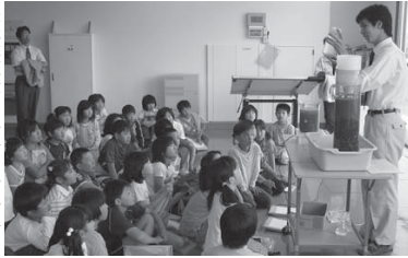
水質検査体験などが行われた昨年の見学会

【日時】 6月1日(木)〜7日(水) ※土日も開催 午前10時〜午後3時まで 【場所】 保呂羽浄水場(登米町寺池道場80番地) 【内容】 浄水場見学、水質検査体験など