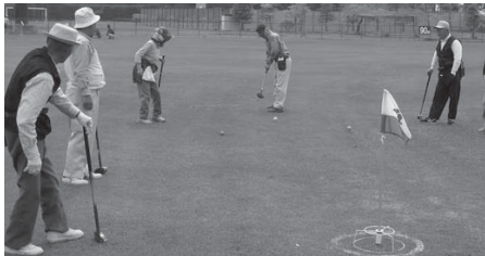
和気あいあいとプレーする参加者

「グラウンドゴルフ大会(G会長杯)」が5月17日、南方総合運動場で開かれました。町内のグラウンドゴルフ協会会員や初挑戦の高齢者ら約110人が参加。上級者の協会員が初心者にスティックを振りぬく力の加減や、ホールポストを狙うポイントなど、丁寧に指導しながら競技が行われました。コート上では対戦相