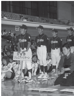
それぞれのユニホーム姿で今後の活躍を誓う団員たち

平成18年度市スポーツ少年団中田支部の結団式が5月15日、なかだアリーナで開かれました。式には今年度新規登録の中田中野球クラブを加えた25単位の団員が、それぞれのユニホー