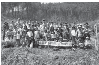
植樹に参加したボランティアの皆さん