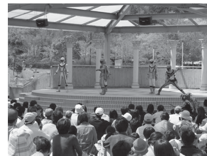
多くの子どもたちが集まったヒーローショー