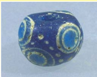
不思議な模様のトンボ玉 (8世紀ごろ)

山根前横穴墓群(石越町)は、昭和27年に宅地造成を目的とした開発行為で発見。全部で10基の横穴墓があり、玉類や鉄製品類、土器類などが出土しています。玉類にはガラス玉や水晶製の切子玉、ヒスイ、メノウなどでできた勾玉などがあります。ガラス玉には、紺・青・黄・緑色などの単色ガラスのみで作られたものと複数の色ガラスを組み合わせたもの(トンボ玉)があり、トンボ玉は全部で9点出土しています。現在、宮城県内からは11点のトンボ玉が出土しており、その80%以上を山根前横穴墓のもので占めています。