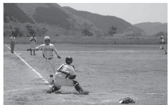
果敢にホームを狙う東和中（対志津川中）

新規認定請求 制度改正により、新たに支給対象となる児童の保護者には、個別に新規認定請求の案内（受付日時、場所、必要なものを記載）を発送しています。 今回の改正では、特例により9月末までに請求があった場合、4月分にはさかのぼって手当が支給されます。 【問い合わせ】 福祉事務所子育て支援室 ☎0220(58)5562