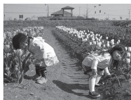
チューリップを背景に多くの家族連れが記念撮影しました

砂嵐による葉の傷みや、資金不足などにより昨年中止となった「米山チューリップまつり」が、地元を愛する市民の手によって復活し、ゴールデンウィーク期間中、町内2