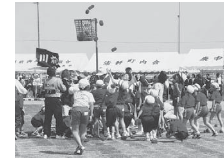
元気いっぱいの豊里小児童と一緒に玉入れをする地区住民

歩くことを通じて健康増進とリフレッシュを目的に、スプリングハイイク(追公民館、追勤労青少年ホーム主催)が4月27日、追町内で開催され、40代から70代までの市民が参加しました。大形地区のスタート地点を出発し、長沼湖畔の美しい景色を眺めたり、会話をしたりしながら、約6・5時をウオーキング。2時間かけて