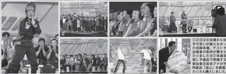
①②③④⑤会場から拍手や笑いが絶えなかった収録本番。ゲストや出場者の歌声が響きわたりました⑥⑦本選目指し予選会で熱唱する参加者⑧宮本アナが市特産品「油ふ」を絶賛。たくさん購入しました。