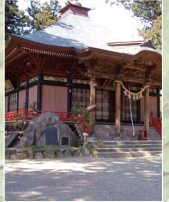
観音堂外側の板壁には色鮮やかな彫り物があり、多くの観光客が見物に訪れます

観音堂の内陣には、伊達家の紋章である「竹に雀」が施され、奥には33年に一度だけ開帳される「本尊・秘仏十一面観音菩薩」がまつられています。また、観音堂外側の板壁には、中国の「二十四孝物語」の彫り物が色鮮やかに刻まれ、休日には多くの観光客が訪れます。そのほか、観音堂の周囲には、薬師堂、白山堂鐘楼、六角堂などがあり、それぞれ歴史を感じさせています。毎年4月には大嶽山春まつりが開催され、「稚児行列」などが行われます。