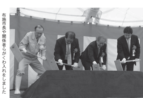
布施市長や関係者がくわ入れをしました

布施市長は「着工から30年余りでやっと最終段階までたどり着いた。ダムは地域の治水、利水の役割だけではなく、湖面を利用したレクリエーション機能に大きな期待を寄せている。無事に工事が終わることを願いたい」と述べました。