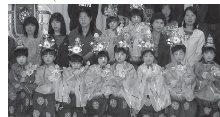
艶やかな着物をまとった北上保育園の園児たち

この日はあいにくの雨模様で、町内の行進はできませんでしたが、子どもたちは着物を着て記念撮影をするだけでも大喜び。園内をはしゃぎ回って楽しんでいました。保護者は「せつかく着物を着てお化粧したのに、雨で町内の行進ができず残念ですが子どもたちのうれしそうなお顔を見られて良かったです」と話していました。