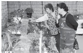
色とりどりの作品が並べられた山野草展示会（追町）

会員が丹精を込めて育て、それぞれが工夫を凝らして創作した作品200点が並べられ、道の駅を訪れた多くの観光客が足を止めました。