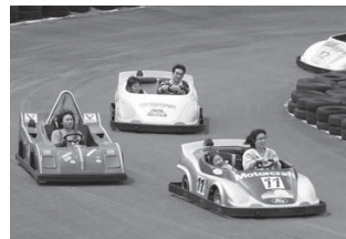
サーキットでゴーカートを楽しむ親子

チャチャワールドいしこしではゴールデンウィーク期間中、県内外から約1万3500人が来場し、親子連れなどにぎわいました。施設中央にある特設ステ