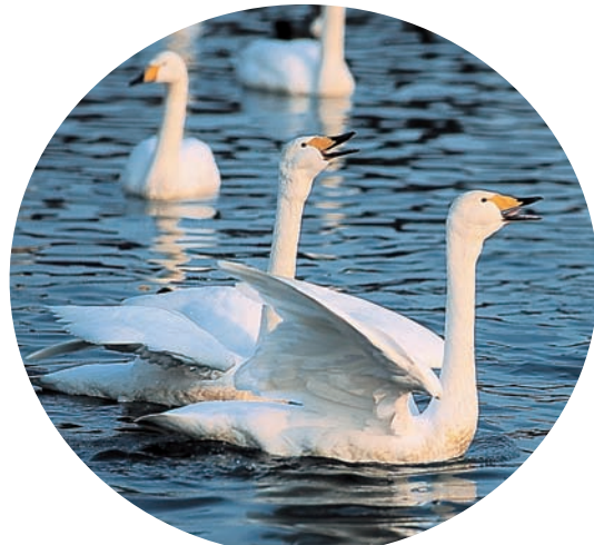
伊豆沼のハクチョウ（迫）

各総合支所支所長から推薦を受けた9人と観光物産協議会から推薦された6人の15人で構成する委員会。市の自然、史跡、歴史、民芸品などを使い、観光・物産振興を通じて地域の活性化を協議しています。