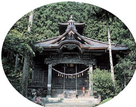
横山不動尊「国指定重要文化財」（津山）