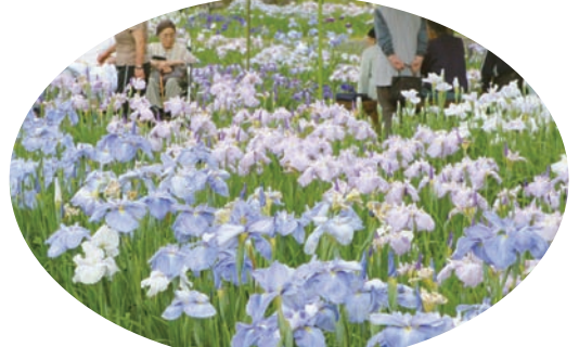
花菖蒲の郷公園（南方）