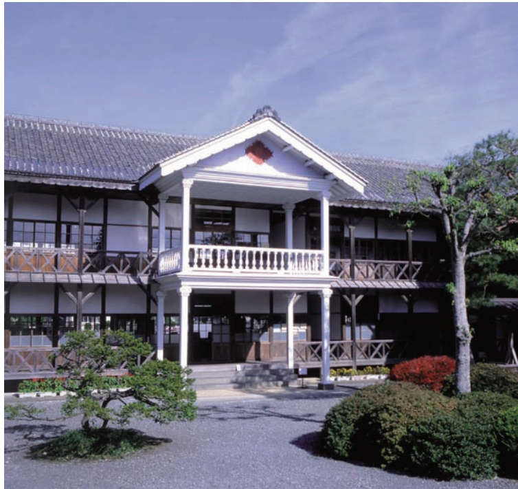
旧登米高等尋常小学校「国指定重要文化財」（登米）