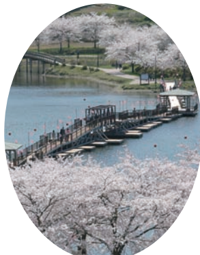
平筒沼ふれあい公園の桜（米山）