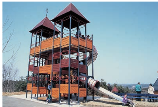
チャチャワールドいしこし（石越）