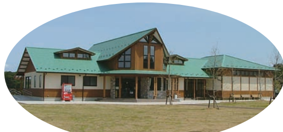
平筒沼農村文化自然学習館（豊里）