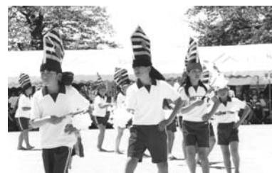
▲4～6年生による畑岡神楽（西郷小）