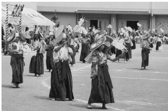
▲5～6年生による鳥舞（石越小）