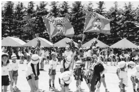
▲全校生徒によるパワフル豊里釜神よさこい（豊里小）