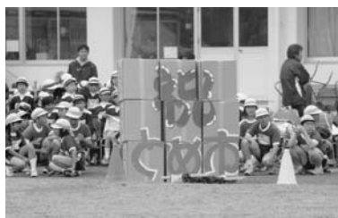
▲5～6年生による合併推進委員会（加賀野小）