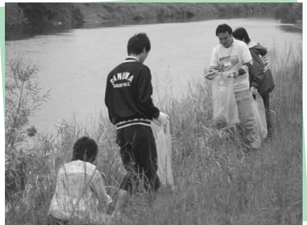
▲迫川河川敷のゴミ拾いをする参加者