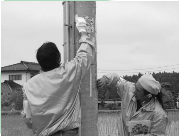
▲有害チラシをはがす参加者

5月29日(日)、有害チラシ撤去大作戦(迫町青年会、長沼花火実行委員会主催)が実施されました。活動には、佐沼警察署、飲食業組合登米支部、東北電力、NTTグループから約30人が参加。長沼付近の県道沿いを2班に分かれ、電柱に張られた風俗営業などの有害チラシをはがしました。