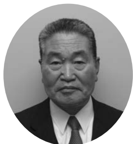
■委員長職務代理者