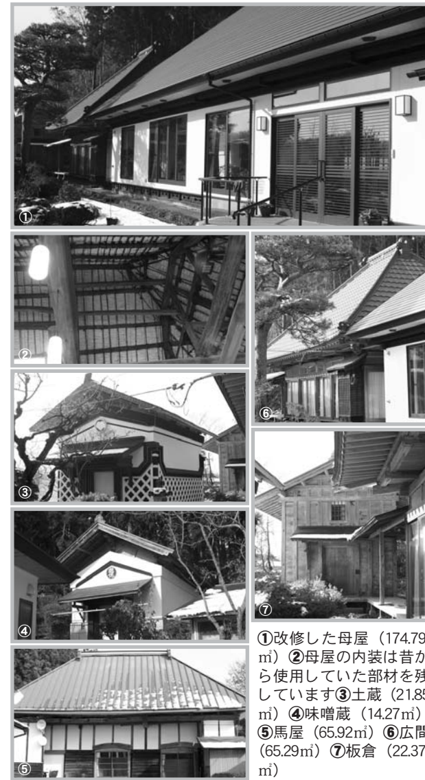
①改修した母屋 (174.79㎡) ②母屋の内装は昔から使用していた部材を残しています③土蔵 (21.85㎡) ④味噌蔵 (14.27㎡) ⑤馬屋 (65.92㎡) ⑥広間 (65.29㎡) ⑦板倉 (22.37㎡)

一昨年、寒さをしのぐため、屋根や内外壁、床に断熱材を使用し、暗い部屋には天窓を取り付けるなどの改修工事を実施していますが、古民家の重厚さは失われていません。 所有者の遊佐桂さんは「改修前はとても寒かった。今ではストーブをたけば母屋全体が温まり、快適に暮らしています」と話します。