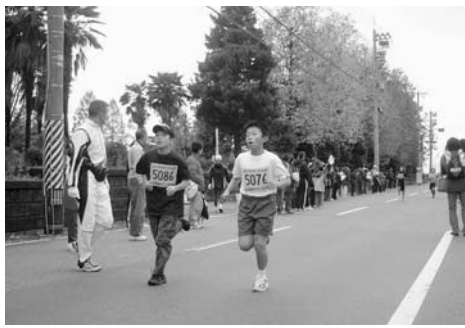
マラソン大会では全員が完走を果たしました

米山町と友好提携を結んでいる富山県入善町で「扇状地マラソンINにゆうぜん」(同町主催)が11月20日、入善陸上競技場で開催されました。