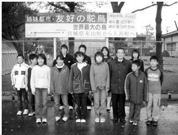
11月19日からの3日間、富山県入善町へ訪問し交流を深めました

米山町と友好提携を結んでいる富山県入善町で「扇状地マラソンINにゆうぜん」(同町主催)が11月20日、入善陸上競技場で開催されました。