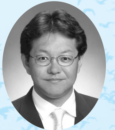
登米市長 布施孝尚