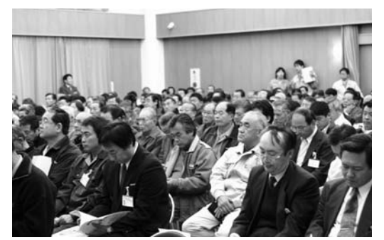
21世紀の新しい農業のしくみを真剣に聞く参加者

集落営農を考える研修会(市担い手育成総合支援協議会主催)が12月13日、宝江ふれあいセンターで開催されました。 市内の認定農業者、集落リーダー、生産組織、関係機関などから270人が参加しました。