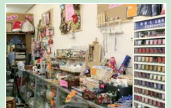
アクセサリや小物も販売しています

編集室から ▼明けましておめでとうございます。2006年もいよいよスタートしました。今年も「広報とめ」をどうぞよろしくお願ひします。▼この広報紙を編集していた12月は、夕方になると事務室が寒くて防寒服を着込んでの編集でした。これからもっと寒くなるので、さらにたくさん着なければ…。▼今年のえとは「いぬ」です。市内のフンちゃんたちが大活躍する年に？（平井）