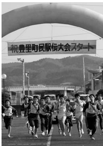
20チームが白熱したレースを展開

第19回豊里地区駅伝競走大会(豊里地区体育協会・豊里公民館主催)が12月4日、豊里公民館前を主会場に開催されました。