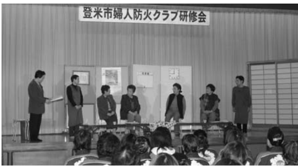
劇団「いなかつペー」がオレオレ詐欺の寸劇を熱演