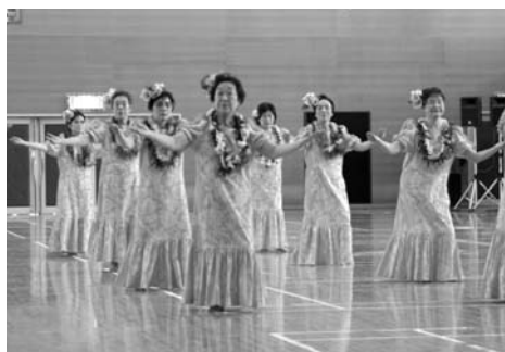
色鮮やかな衣装でレクダンスをしました

第6回市レクダンス交流会(市レクダンス・サークル交流会実行委員会主催)が11月26日、なかだアリーナで開催されました。レクダンスとは、レクリエーションダンスのことで、演歌やポップス、ジャズなど