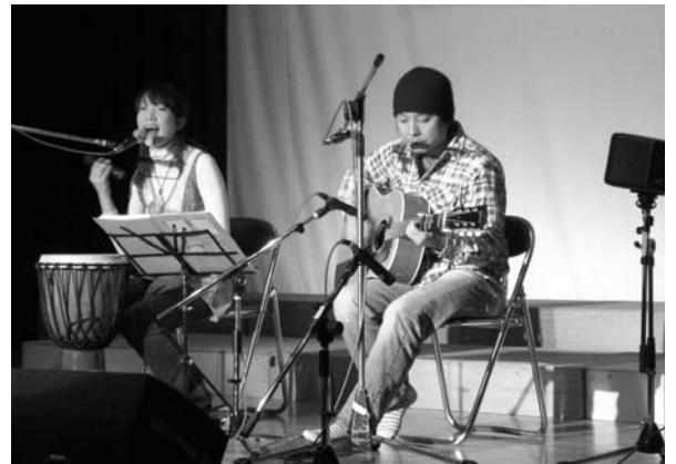
市内のアマチュアバンドが多数出演（第14回なかだ音楽祭）

奏楽部のジョイントコンサート（両校部員総勢95人）が登米祝祭劇場で開催されました。 このコンサートは、今年で11回目の開催となるもので、両校の担当教諭の発案で、子どもたちが音楽を通じて交流を深めることを目的に毎年開催されてきました。 始めに米岡小、石越小が順に演奏、その後両校の合同演奏でマーチ「春風」と「上を向いて歩こう」の2曲を披露。息の合った演奏で観客を魅了しました。アンコールに「上を向いて歩こう」で感動のラストを飾りました。 演奏後は、児童たちから先生方へ花束がプレゼントされ、