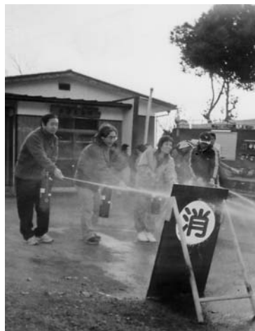
消火訓練をする長根区住民

長根区民による自主防災訓練(同行行政区主催)が11月27日、長根集会所を会場に実施され、32人の地区住民が参加しました。