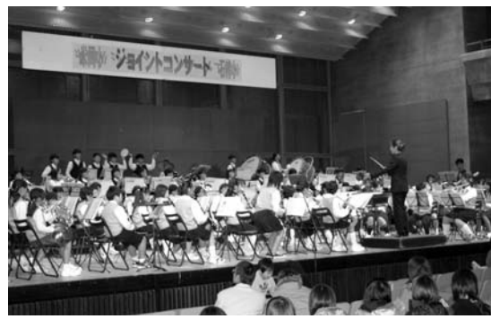
息の合った演奏を披露（米岡・石越小ジョイントコンサート）

音楽祭やコンサートなどの催しが11月から12月にかけて市内各地で開催されました。 中田町では、第14回なかだ音楽祭（同音楽祭実行委員会主催）が11月27日、中田農村環境改善センターで開催されました。 幼稚園から一般までの18団