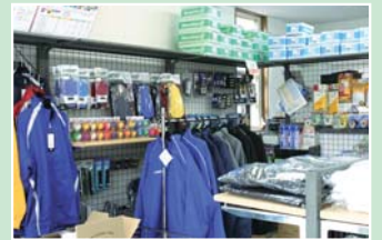
スポーツ全般の商品を取り扱っています