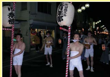
昨年のどんと祭の模様