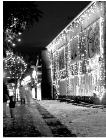
多くの家族連れなどが光の世界を堪能

「おおあみイルミネーションロードまつり」（大網商工振興会主催）が12月10日から始まりました。 初日の午後5時から迫町佐沼大網の石倉倉庫前で点灯式が行われ、街路樹や倉庫の壁