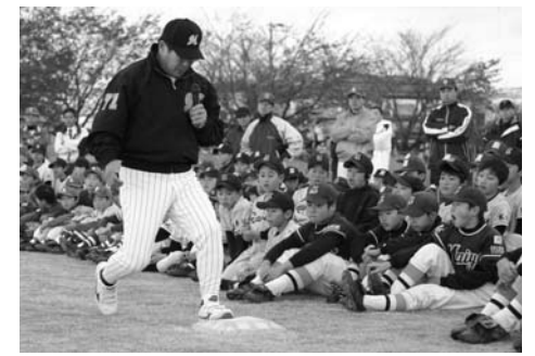
走塁方法を真剣な表情で学ぶ団員たち

少年少女野球教室(市スポーツ少年団野球協議会主催)が11月20日、迫町光ヶ丘球場で開催され、市内21のスポーツ少年団から、団員や指導員、保護者ら350人が参加しました。 協議会結成20周年を記念し、