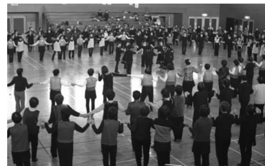
16サークル350人によるレクダンス

第6回市レクダンス交流会(市レクダンス・サークル交流会実行委員会主催)が11月26日、なかだアリーナで開催されました。レクダンスとは、レクリエーションダンスのことで、演歌やポップス、ジャズなど