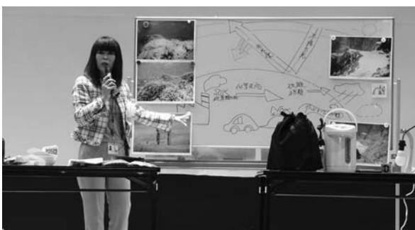
地球温暖化対策の講演がありました

市婦人防犯クラブ研修会(同クラブ主催)が11月18日、迫公民館で開催されました。市内の婦人防犯クラブから150人の会員が参加。宮城県総務部危機対策課職員を講師に、「宮城県沖地震に備えて」と題した講演会がありました。また、アトラクションでは、迫町の劇団「いなかつペー」