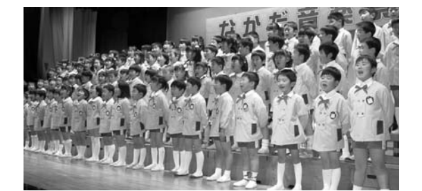
中田幼稚園の合唱（第14回なかだ音楽祭）

観客からも温かい拍手が送られました。 12月11日には、第11回とめ「水の里」合唱フェスティバル（同フェスティバル実行委員会）が登米祝祭劇場で開催されました。 市内12のコーラス団体と佐沼高等学校合唱部の皆さんが、日ごろの練習成果を披露。各団体の素晴らしい歌声に、大きな拍手と声援が寄せられました。 演奏の最後は、「水の里」を出演者と観客全員の大合唱で締めくくりました。 各会場で行われた音楽の催しでは、素晴らしい歌声や演奏が響き渡りました。