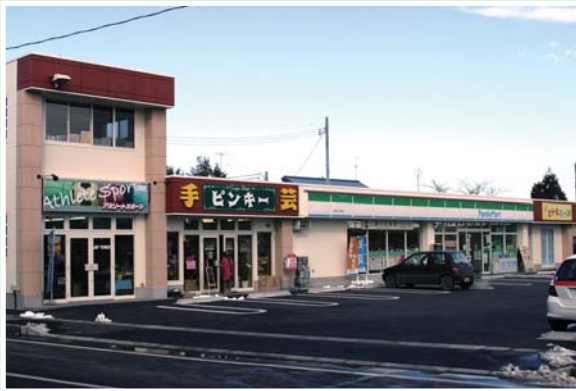
駐車場は表裏に2個所設置され、どなたでも気軽に入店できます

中田町上沼に、スポーツ店や手芸店、飲食店などが集めた店舗がオープンしました。場所は国道346号の黒沼十文字交差点付近で、普通車46台分の駐車場が完備されています。立地条件が良く、気軽に立ち寄ることができますので、足を運んでみてください。