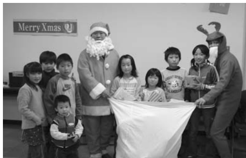
サンタさんとプレゼントを手にする子どもたち

市国際交流のつどい・クリスマスパーティー2005(市国際交流協会主催)が12月8日、迫公民館で開催されました。