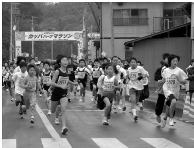
小学生各学年・男女・2部の部が一斉にスタート

第20回記念カップハーフマラソン（カップハーフマラソン実行委員会主催）が11月27日、登米総合体育館前を主会場に開催されました。