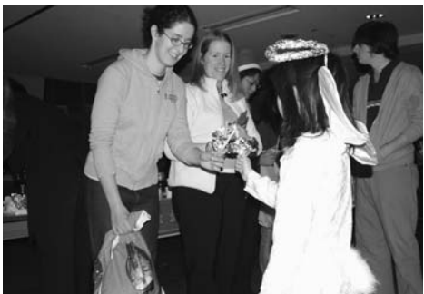
小学生が天使の装いで火をともしました