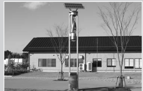
市で助成を受けて設置した南方緑地公園内のハイブリット防犯灯(※)

市内のコミュニティ協議会など15団体と市では、平成17年度「コミュニティ助成事業(宝くじ助成事業)」を受け、祭り用具や各種イベントで活用できる備品などを整備しました。 この事業は、財団法人自治総合センターが宝くじ受託収入を財源に、コミュニティ組織などの健全な発展と宝くじの普及広報を目的として実施しています。 購入した備品などは次のとおりです。