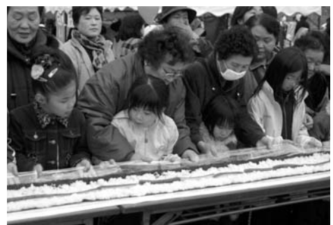
会場では120個のカップケーキ作り挑戦

第20回記念カップハーフマラソン（カップハーフマラソン実行委員会主催）が11月27日、登米総合体育館前を主会場に開催されました。