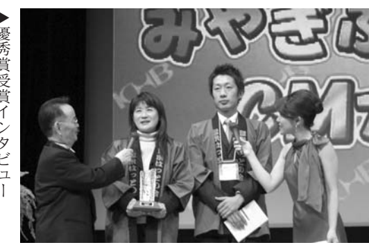
▶優秀賞受賞インタビュー

員が役者として参加。これから1年間で50回、登米市のCM「とめ御法度(ごはつと)物語」が放映されます。※作品は登米市のホームページでも見ることができます。 【PR】http://www.city.tome.nyagi.jp/ ぜひご覧ください！ ◆審査会放映 平成18年1月2日(月)午後2時から 東日本放送