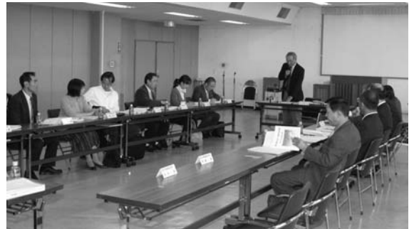
新市総合計画などの審議をします