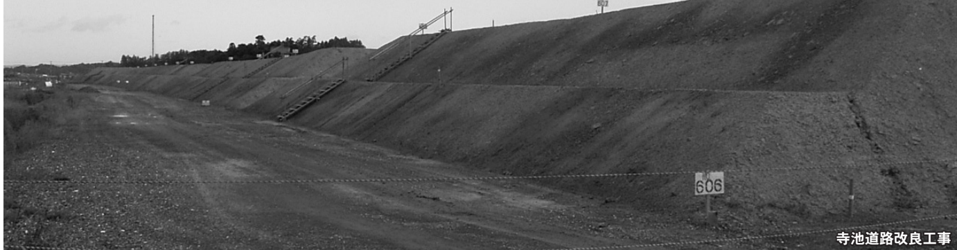
寺池道路改良工事