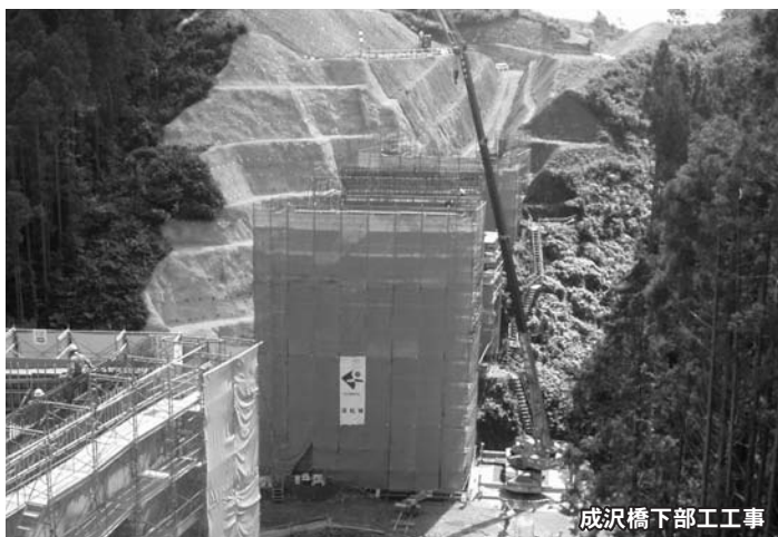
成沢橋下部工工事

河川橋では東北地方一の支間長（144m）を誇る、新米谷大橋の橋台2基、橋脚3基の下部工を施工。現在、河川内を施工中。