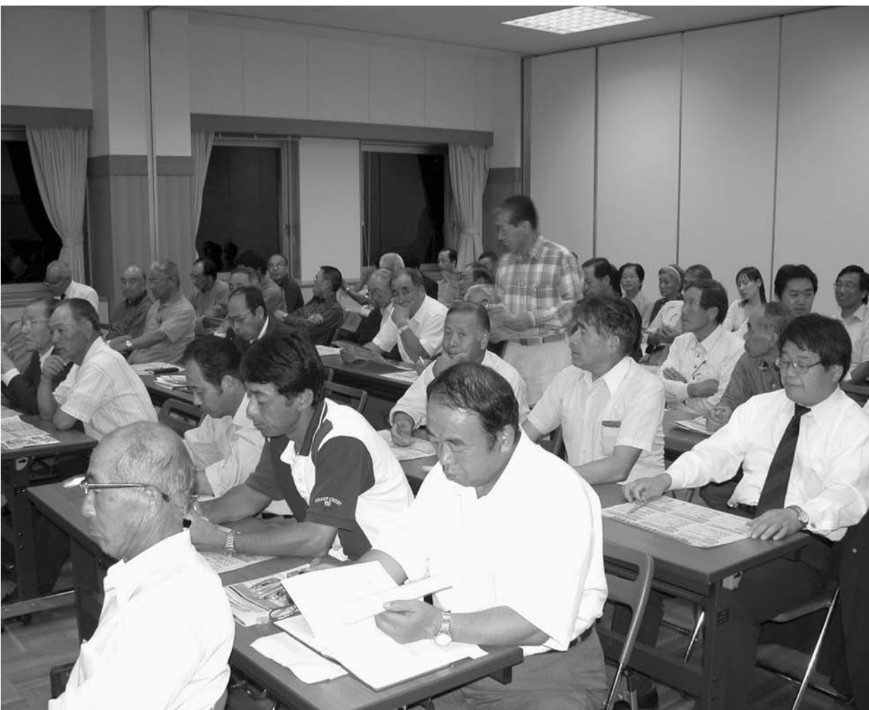
各地域に分かれてまちづくり懇談会が開催されました（写真は東和地域）

9月1日から14日にかけて、登米市総合計画・国土利用計画策定に伴う「まちづくり懇談会」が各地域で開催されました。懇談会には延べ457人の方々に参加し、さまざまな意見や要望が出されました。懇談会で出された課題などの中から、主なものを取り上げてお知らせします。