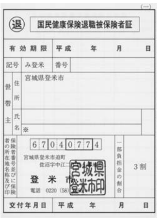
▲退職被保険者証は白色です