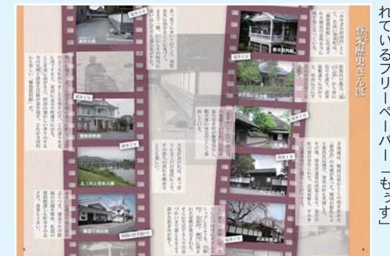
登米町の魅力が盛りだくさんに掲載されているフリーペーパー「もっす」