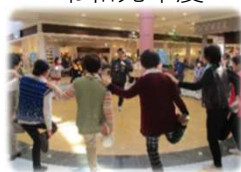
令和元年度のレッスンの様子